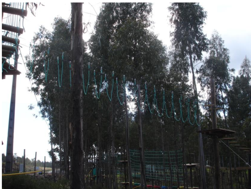
Ponte de cordas em U

CALDEIRA MARQUES- LAZER E TURISMO, LDA. - RNAAT 20/2013 Praça Pedro Ferreira, nº 15, 2º dto. 2240-342 Ferreira do Zêzere Tel: 925875479/918523134 Email: kaventura.cm@gmail.com Site: www.kaventura.com