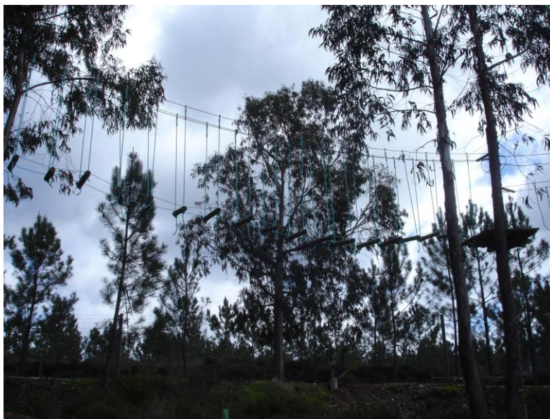
Ponte de trapézios