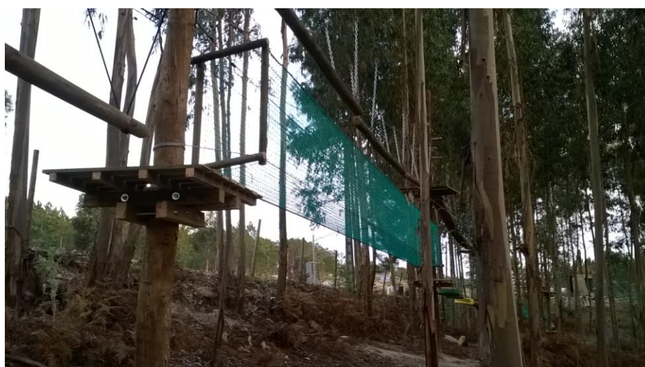
Ponte túnel de rede

CALDEIRA MARQUES- LAZER E TURISMO, LDA. - RNAAT 20/2013 Praça Pedro Ferreira, nº 15, 2º dto. 2240-342 Ferreira do Zêzere Tel: 925875479/918523134 Email: kaventura.cm@gmail.com Site: www.kaventura.com