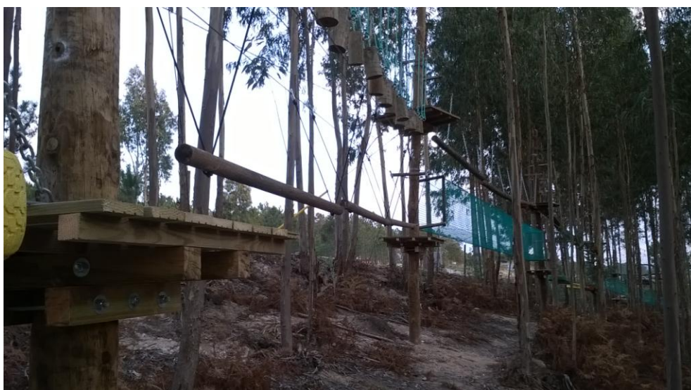
Ponte de paus suspensos