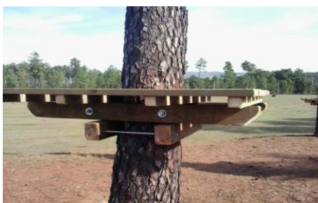
imagem da plataforma

Serão instaladas plataformas em madeira tratada compostas cada uma por: 1 “cadáver” como fixação à árvore/ poste; 4 traves colocadas perpendicularmente ao “cadáver”; preenchimento das traves com tábuas em deck constituindo o piso da mesma.