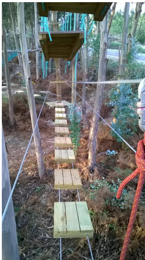
Ponte de bolachas