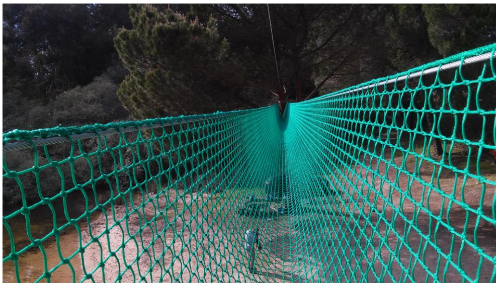
Ponte himalaia com rede