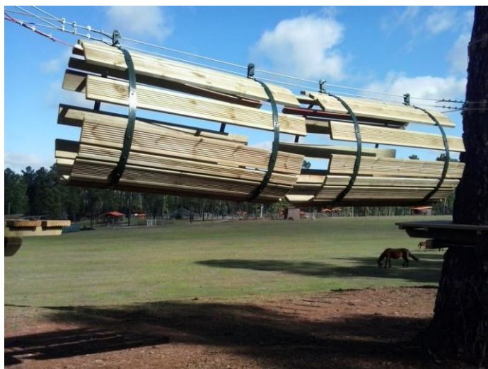
Ponte de bidons