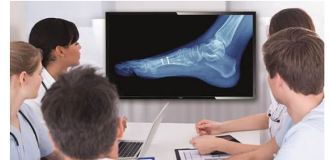
Imagem D clínica

A imagem D ajuda-o a analisar e diagnosticar imagens clínicas com um desempenho de visualização consistente e preciso. Para obter interpretações clínicas fiáveis, os nossos ecrãs profissionais são calibrados de fábrica para oferecer um desempenho de visualização padrão otimizado da escala de cinzentos. A imagem D ajuda-o para alcançar um nível de excelência em todos os aspectos dos cuidados de pacientes.