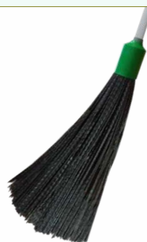
Refª 162/ER - Recarga de vassoura com filamento em polipropileno de 42 cm. Formato redondo e cor preta. Peso: 0,740 Kg. Compatível para cabo 162/F1M e 162/F1A.