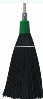
Refª 162/EP - Recarga de vassoura com filamento em polipropileno de 43 cm. Formato plano e cor preta. Peso: 0,800 Kg. Compatível para cabo 162/F1M e 162/F1A.