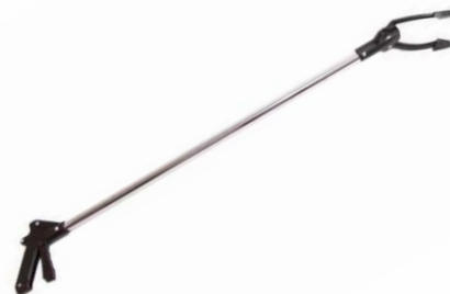
Refª 288 - Pinça multiusos em alumínio Comprimento: 100 cm Peso: 1 Kg