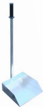
Refª 134/D - Pá em aço galvanizado Comprimento: 85 cm. Peso: 3,5 Kg. Refª 134/F - Pá em alumínio Comprimento: 85 cm. Peso: 1 Kg.