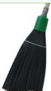
Refª 162/EPR - Recarga de vassoura com filamento em polipropileno de 41 cm. Formato plano/recortado e cor preta. Peso: 0,720 Kg. Compatível para cabo 162/F1M e 162/F1A.