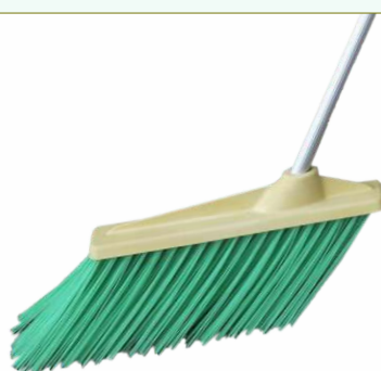
Refª 162/E5460 - Recarga de escovão com filamento em polipropileno de 24,5 cm. Formato plano e cor verde. Peso: 0,930 Kg. Compatível para cabo 162/F3A.