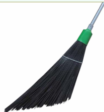
Refª 162/EPRV75 - Recarga de vassoura com filamento em polipropileno de 75 cm. Formato plano em «V» e cor preta. Peso: 0,850 Kg. Compatível para cabo 162/F1M e 162/F1A.