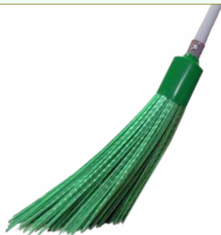
Refª 162/ERRVV - Recarga de vassoura com filamento em polipropileno de 42 cm. Formato REDONDO em «V» e cor verde. Peso: 0,660 Kg. Compatível para cabo 162/F1M e 162/F1A.