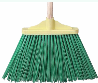
Refª 162/E460 - Recarga de vassoura com filamento em polipropileno de 22 cm. Formato plano e cor verde. Peso: 0,210 Kg. Compatível para cabo 162/F2M e 162/F2A.