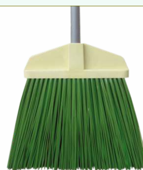
Refª 162/E500 - Recarga de vassoura com filamento em polipropileno de 24 cm. Formato plano e cor verde. Peso: 0,500 Kg. Compatível para cabo 162/F2M e 162/F2A.