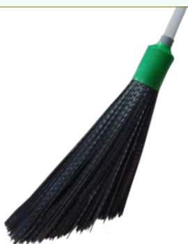
Refª 162/ERRVP - Recarga de vassoura com filamento em polipropileno de 42 cm. Formato redondo em «V» e cor preta. Peso: 0,660 Kg. Compatível para cabo 162/F1M e 162/F1A.